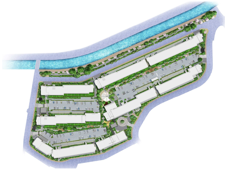
全8棟がすべて南方位に向けた住棟計画