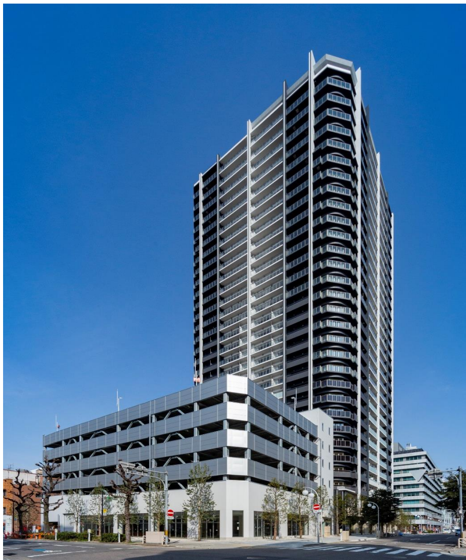
■プライドタワー名古屋錦（南東側より区域全体を望む）

野村不動産株式会社(本社：東京都新宿区/代表取締役社長：松尾 大作)、旭化成不動産レジデンス株式会社(本社：東京都千代田区/代表取締役社長：兒玉 芳樹)、NTT都市開発株式会社(本社：東京都千代田区/代表取締役社長：辻上 広志)、株式会社長谷工不動産(本社：東京都港区/代表取締役社長：天野 里司)、株式会社長谷工コーポレーション(本社：東京都港区/代表取締役社長：池上一夫)は、名駅エリアと栄エリアの中間に位置する伏見・錦二丁目エリアで地権者の皆様や地域の方々と推進しております『プライドタワー名古屋錦』が竣工したことを、お知らせいたします。