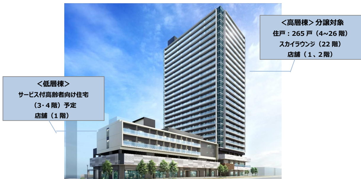
「アトラスタワー草津」を含む複合開発の完成予想パース

一次取得者層だけでなく、来場者の約 6 割は既に持家のお客様であったことが特徴です。至便な駅前立地への住み替えや買い替えなどの利用用途が推定されます。