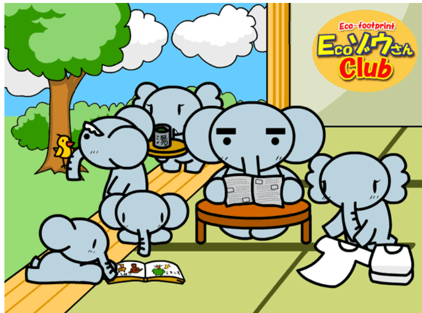
デスクトップキャラクターの ECOゾウさんファミリー

サイトの開設にあたっては、お子様を中心に家族で楽しみながら利用できるように、「ECOゾウさん」というデスクトップキャラクターを設置し、アニメーションなどを利用して簡単な操作で楽しくゲーム感覚で参加できるように工夫されています。